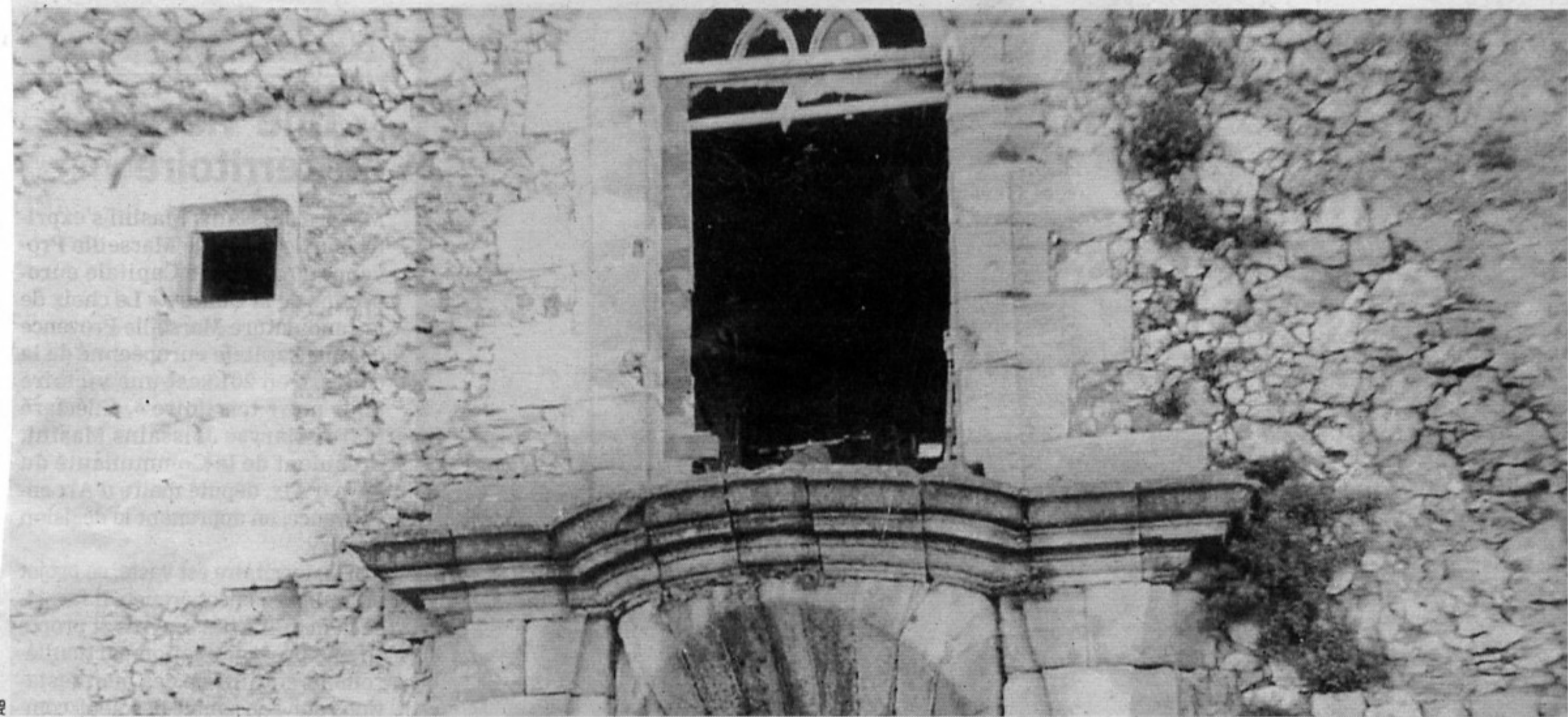
Trompe hémisphérique de l'ancienne porte du Château (XVIIIe).

Peyrolles /Jouques. Un intéressant programme des journées du patrimoine 2008.